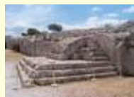
La tribune des orateurs, Athènes

Et pourtant, même si le progrès technique a le mérite de profiter à tous, il n'est que l'œuvre de quelques-uns. C'est en cela que l'invention de la démocratie est extraordinaire.