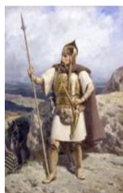
Les Gaulois, vus du 19e siècle.

Le cas des Gaulois est particulier, sans doute parce que, l'école républicaine étant passée par là, nous devons être fiers de ces "ancêtres". On estime aujourd'hui, avec la plus grande satisfaction, qu'ils étaient loin d'être les barbares ignares et belliqueux décrits par Jules César, qui lui aussi falsifiait l'Histoire : quelle gloire tirerait-on à vaincre sans péril des peuples estimables !